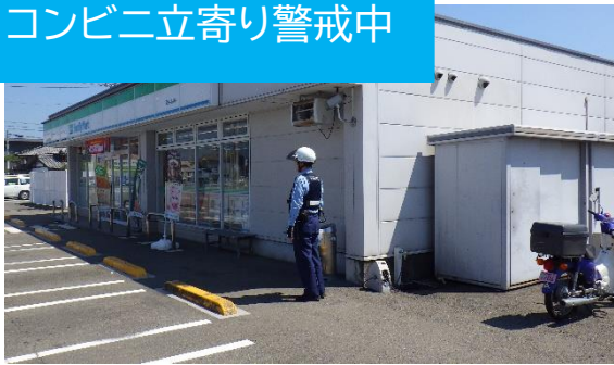
コンビニ立寄り警戒中

みなさんの安全・安心を守りながら、熱中症対策を実施しておりますのでご理解・ご協力をよろしくお願いいたします！